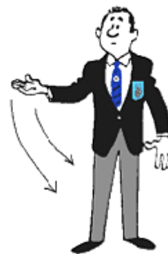
POZIV ZA ZDRAVNIKA